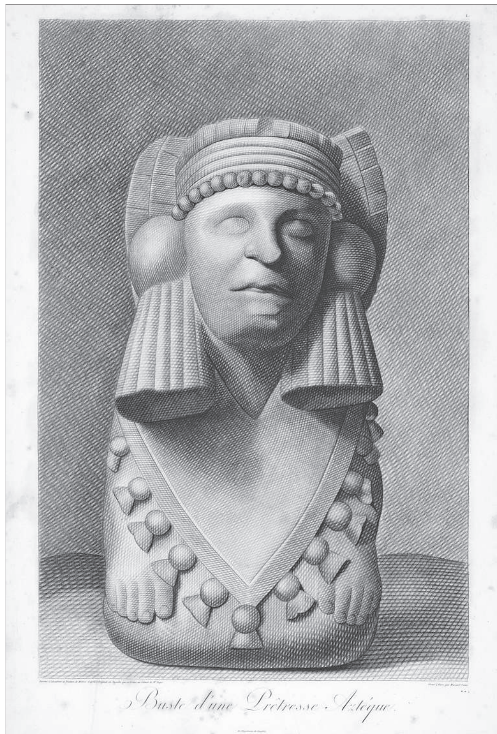
Chalchiuhtlicue, déesse aztèque de l'eau. Sous la gravure est indiqué «dans le cabinet de Mr Dupé», d'après Humboldt A. 1810. Vues des Cordillères, et monumens des peuples indigènes de l'Amérique . Planche 1, volume 2. Imprimeur F. Schoell, Paris.

En 1810, avec l'ouvrage Vues des cordillères, et monumens des peuples indigènes de l'Amérique , le monde occidental découvre sous la plume du jeune explorateur prussien les premières descriptions scientifiques de vestiges archéologiques et d'édifices antiques provenant du «Nuevo Mundo». C'est l'un des tous premiers recueils qui permet de sensibiliser le public et les spécialistes à l'existence de témoins de sociétés antiques précolombiennes jusqu'alors méconnues, voire inconnues, telles que les cultures mayas et aztèques. Il faudra encore plus de 50 ans pour que ces civilisations soient reconnues comme telles par les savants européens. Etant donné que l'intérêt pour l'histoire des civilisations anciennes est dans l'air du temps depuis la fin du XVIII e siècle et grâce aux recherches contemporaines effectuées lors de la récente campagne d'Égypte par les troupes napoléoniennes (1798-1801), la diffusion des découvertes effectuées aux Amériques va susciter, dès la première moitié du XIX e siècle, un engouement de plus en plus grandissant auprès des milieux scientifiques et des personnes