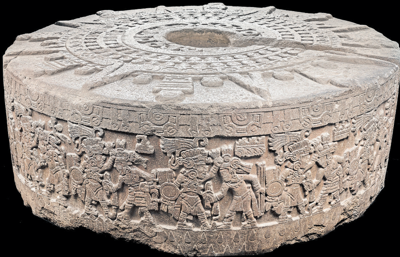
Pierre de Tizoc (roi aztèque de 1481 à 1486). Basalte. Pierre de sacrifices découverte en 1791 lors des travaux de construction de la grande place près du Templo Mayor à Mexico.