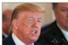
Trump will zunächst nicht mit militärischen Mitteln reagieren.

Bagdad/Washington/Teheran. Mehr als ein Dutzend Raketen haben die Iraner in der Nacht zum Mittwoch in Richtung zweier Militärstützpunkte im Irak abgeschossen, die auch von US-Militär genutzt werden. Nicht einmal eine Woche hat es gedauert, bis Irans Führung ihre Vergeltung für die Tötung ihres Top-Generals Ghassem Soleimani verübt hat. Den Schlag der Amerikaner beantworteten die Iraner mit einem Gegenschlag – allerdings mit