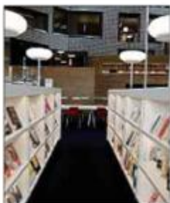
Eine Bibliothek zum Wohlfühlen

Nach ihrem Umzug von der Oberstadt in das Europa- und Bankenviertel hat sich die Bibliothek neu erfinden müssen und wächst derzeit mit ihrer Leserschaft in ein neues Umfeld hinein – etwas was ihr geduldet ist, wie rezente Statistiken zeigen. Doch nicht nur die steigenden Zahlen bei den